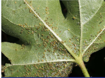
Pamuk Yaprak Biti

Yeni açılmış 2 Yumurta Paketi / 100 Bitki veya 10 Larva / 100 Bitki