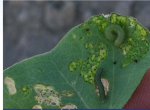
Çizgili Pamuk Yaprak Kurdu

Yeni açılmış 2 Yumurta Paketi / 100 Bitki veya 10 Larva / 100 Bitki