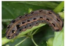
Pamuk Yaprak Kurdu

0.5 Larva / Bitki veya 2 Yumurta Paketi / 25 Bitki